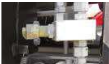
Capteur de fin de course haut et bas.