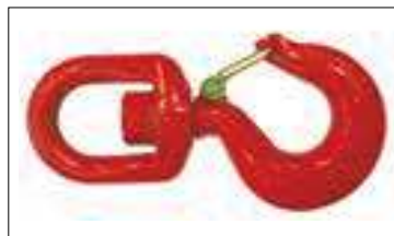
Sécurité : crochet pivotant autobloquant homologué.